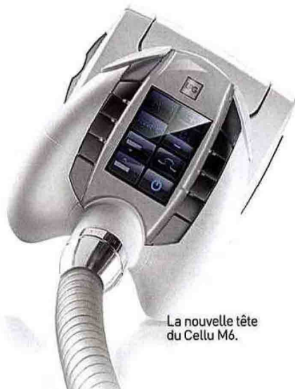
La nouvelle tête du Cellu M6.

Cette disgrâce très localisée est due à la position assise prolongée qui écrase la graisse. Le tissu est comprimé en permanence et les échanges se font mal. Résultat : les fesses deviennent "carrées" et elles manquent de galbe.